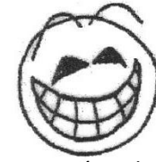
v extázi, plný radosti