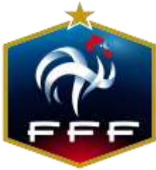
Logo Francouzské fotbalové federace