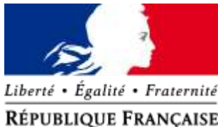
Moderní logo Francouzské republiky